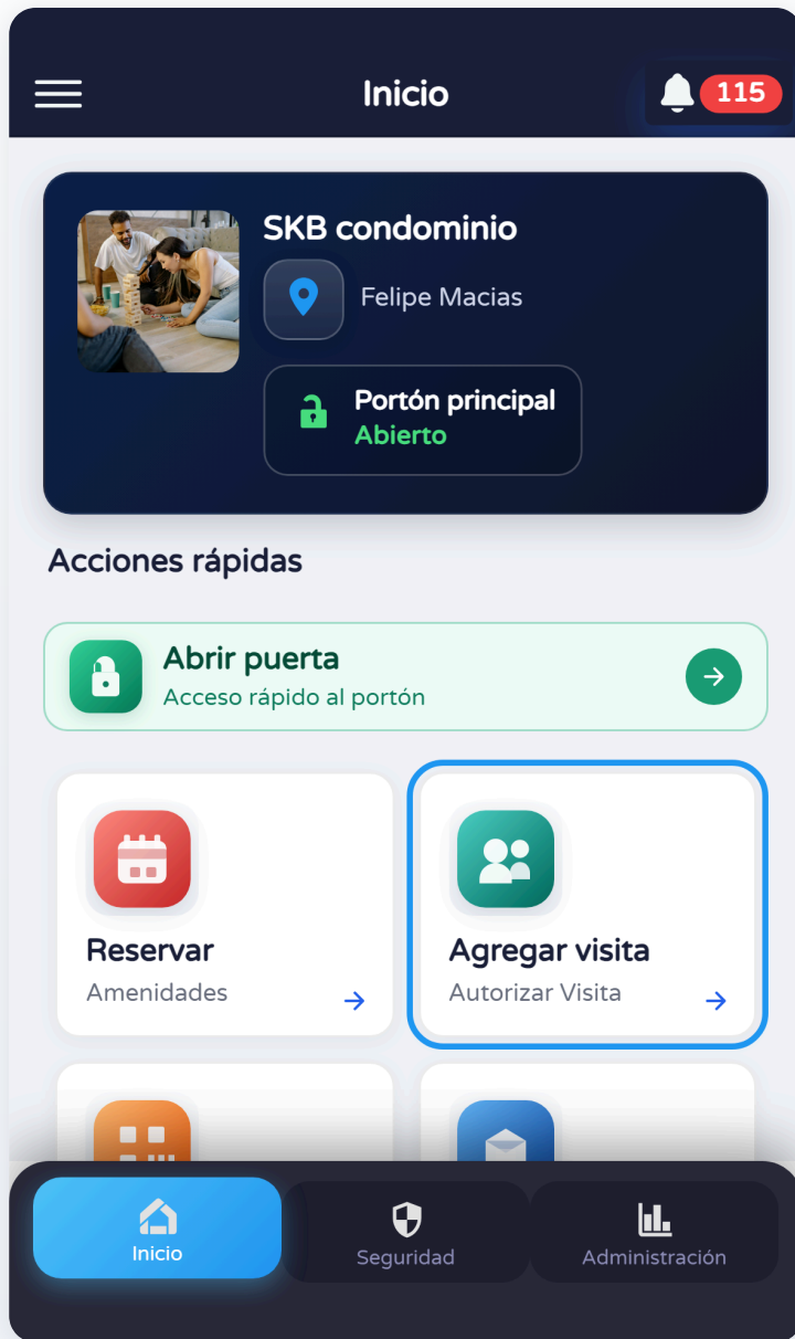
Perfil — tarjeta Agregar visita