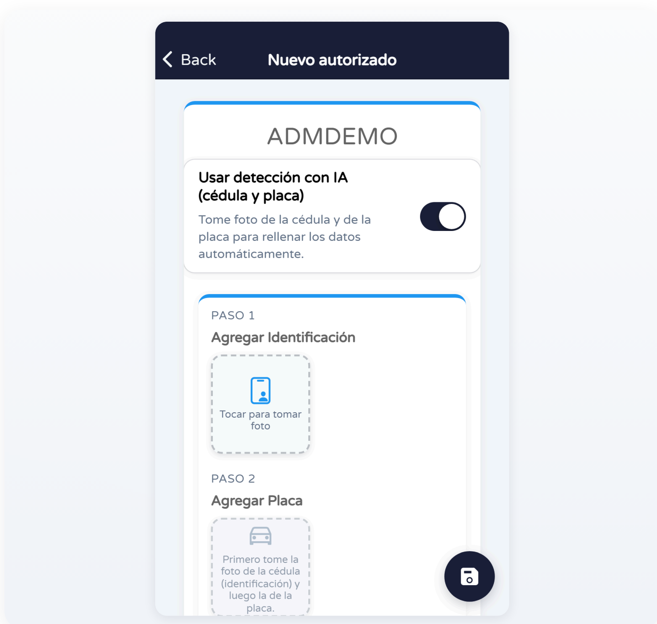
Formulario Nuevo autorizado

Completá los campos que solicite tu conjunto (visita, vigencia, tipo de acceso, etc.) y guardá con el botón indicado.