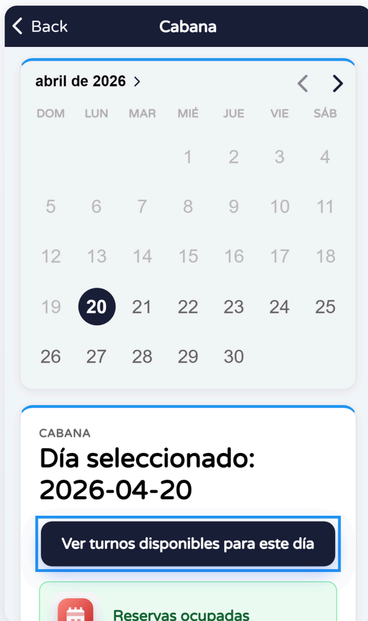
Calendario — disponibilidad y botón para ver turnos

En las capturas puede verse un contorno azul alrededor del botón: es solo para el manual.