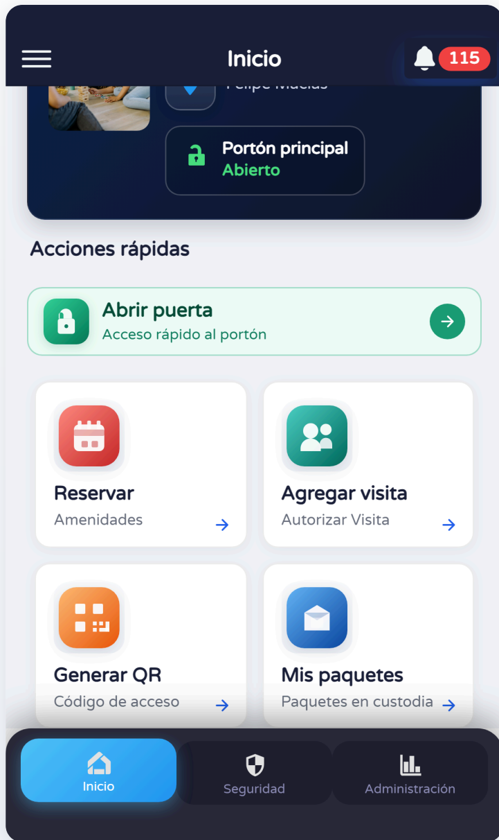
Perfil — tarjeta Generar QR