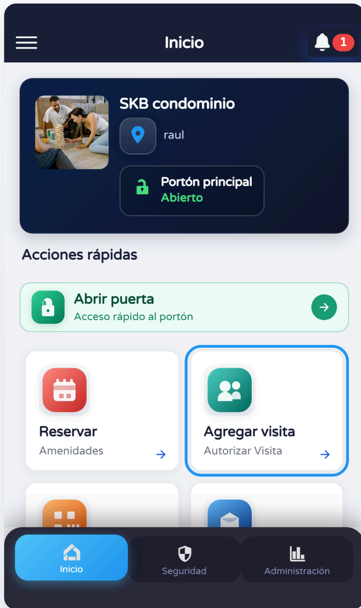
Perfil — tarjeta Agregar visita